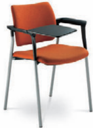
110/B. + TP