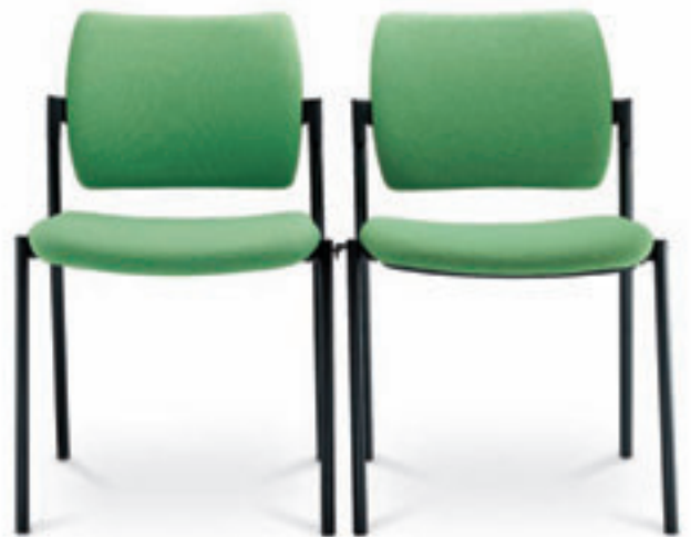
110. + SR