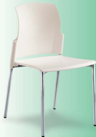
| 25C1 01 P20