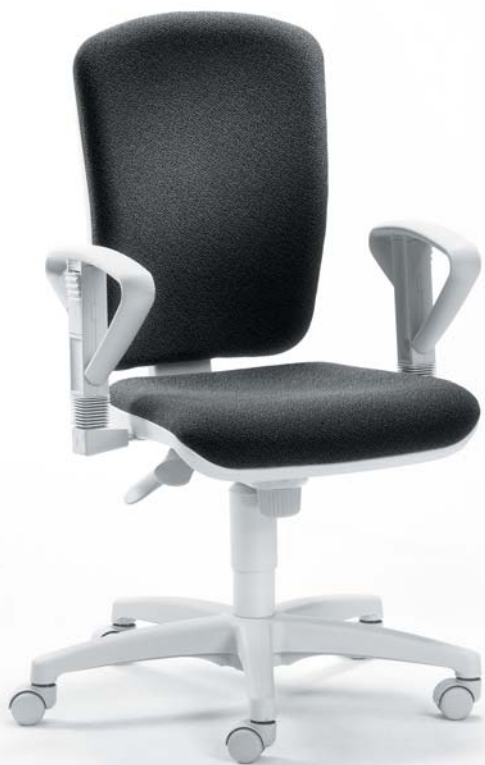
| 2269 G N AV 26 147