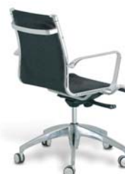
| 24C2 66