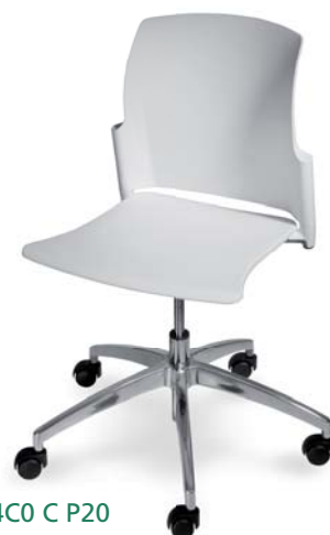
| 24C0 C P20