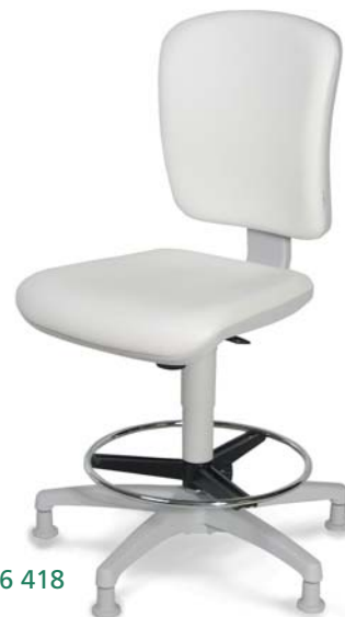
| 2248 med N 26 418