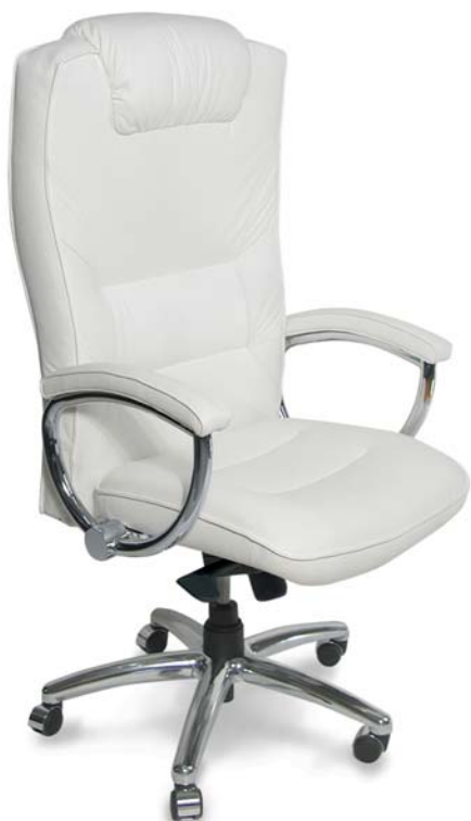
| 2478 C RC 81 008

Kostra chrom nebo stříbrná! Čalounění kůže nebo látky - viz poslední strana!