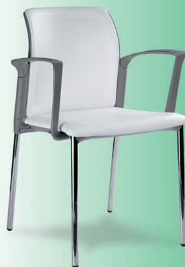
| 25C1 01 P17 A, RP1+RS1 26 418