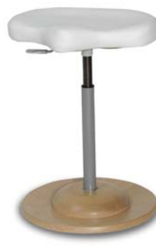
| 1108 N 26 418