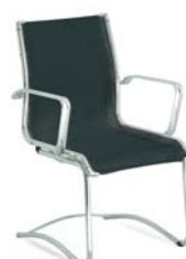
| 25C3 66