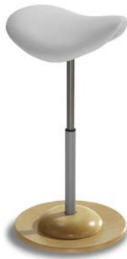
| 1107 N 26 418