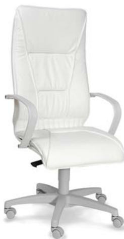
| 2463 G 26 418