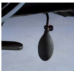
Bederní opěra modelu 2478 s komfortním nastavitelným vzduchovým vakem a pumpičkou