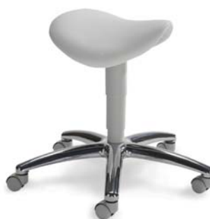
| 1207 G 26 418