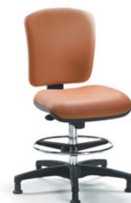
| 2208 S N 26 449