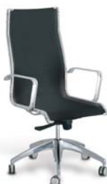
| 24C1 66