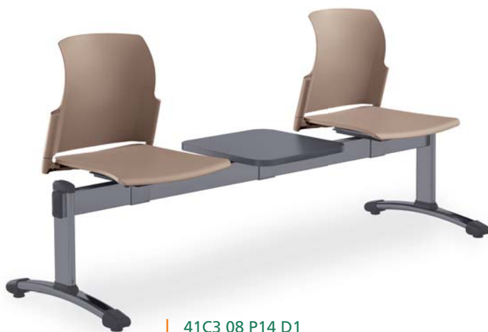
| 41C3 08 P14 D1