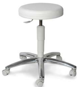
| 1256 G 26 418

nezávisle otočný sedák volnost pohybu 360°