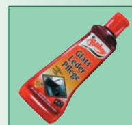
Prostředek na údržbu a čištění kůží (zejména světlých)

Kostra světle šedá nebo černá! Čalounění kůže, látky nebo koženky - viz poslední strana!