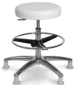
| 1205 G 26 418