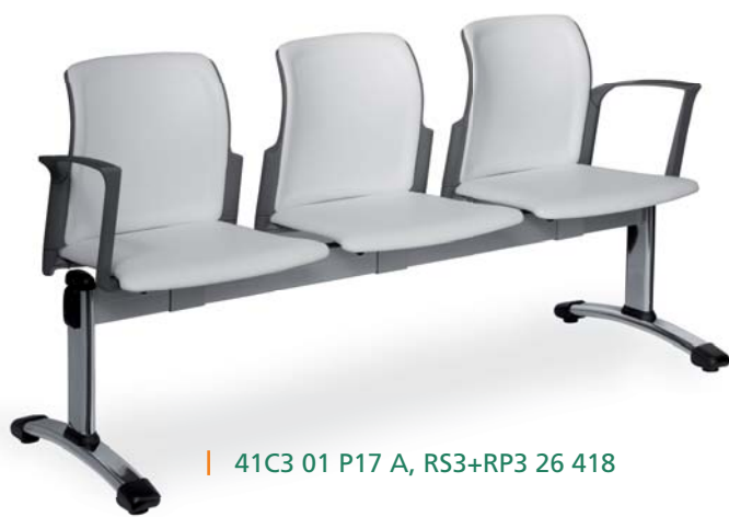
| 41C3 01 P17 A, RS3+RP3 26 418