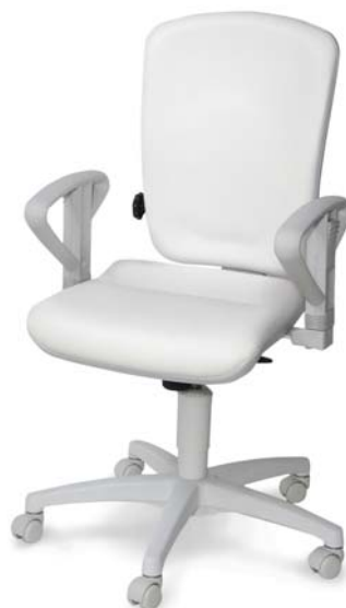
| 2270 G N AV LW BS 26 418