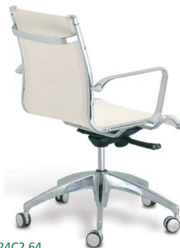
| 24C2 64