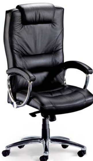
| 2478 C RO 81 007