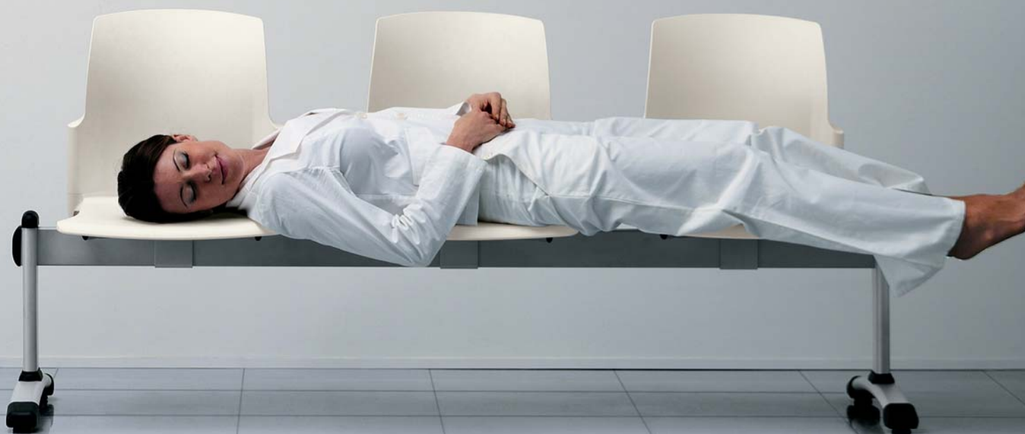
| 41C3 08 P20