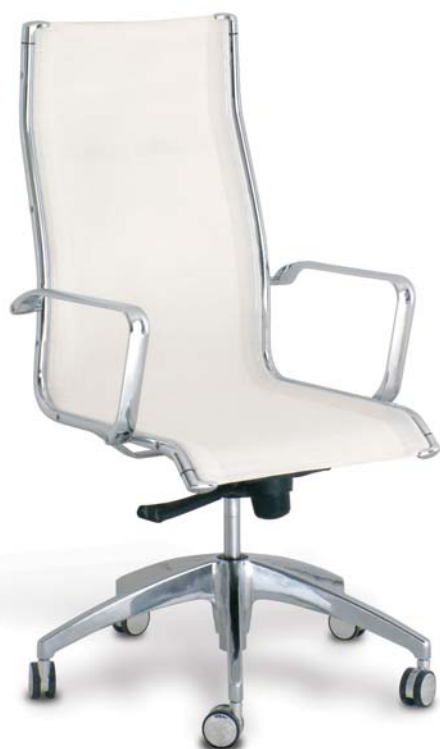
| 24C1 64

...s hygienicky udržovatelným čalouněním