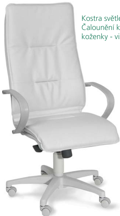
| 2496 G 81 008

Kostra světle šedá nebo černá! Čalounění kůže, látky nebo koženky - viz poslední strana!