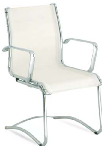
| 25C3 64