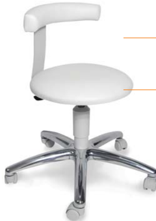
| 1253 G 26 418

nezávisle otočná opora zad / lokte volnost pohybu 360°