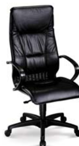
| 2463 S 81 007

...s koženkovým, látkovým nebo koženým čalouněním