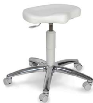
| 1257 G 26 418