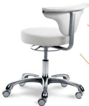
| 1252 118