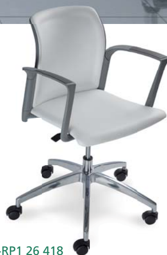
| 24C0 C P17 A, RS1+RP1 26 418