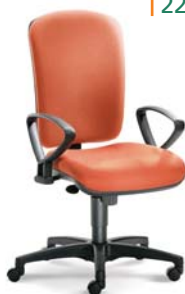
| 2268 S N A 26 279

...s koženkovým nebo látkovým čalouněním