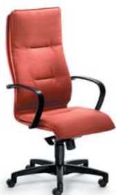
| 2496 S 30 288