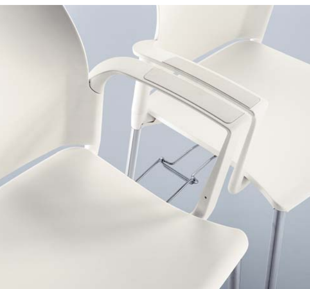
■ detail spojování do řady