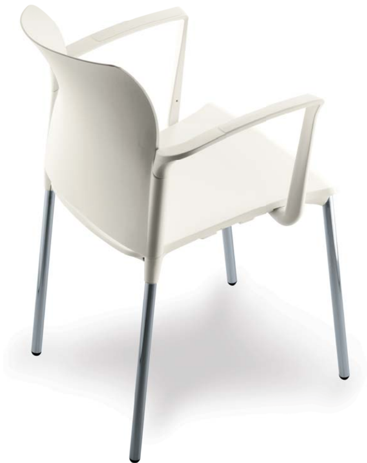
| 25C1 01 A P20